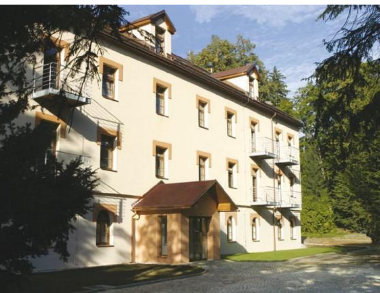
BENT HOLDING, a.s. Rekonstrukce lázeňského domu Božena Velké Losiny