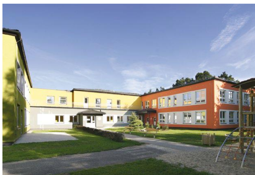
Město Šumperk Stavební úpravy MŠ Prievidzská Snížování energetické náročnosti