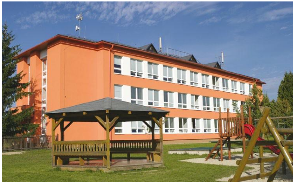
Obec Bludov Snížení energetické náročnosti základní školy